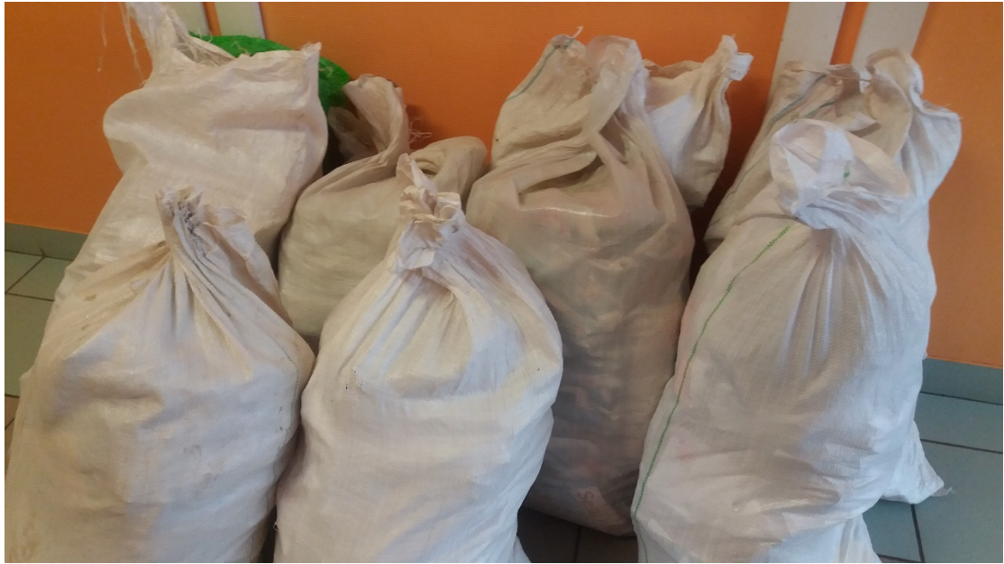
Maisi ar makulatūru