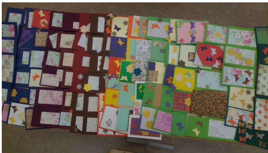
100 apsveikuma kartiņas

1) Aizsūtīja 100 pavasara apsveikuma kartiņas sociālās aprūpes centros dzīvojošiem cilvēkiem, uzsverot, ka viņi ir daļa no mūsu valsts un simtgades!